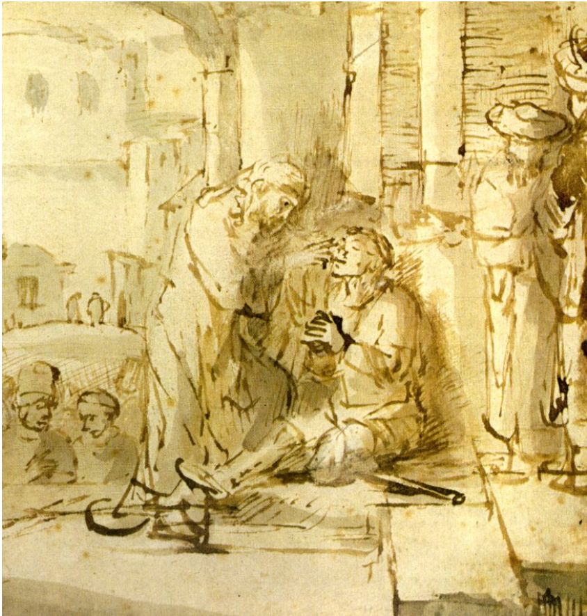
Rembrandt Heilung des Blindgeborenen am Sabbat Im Koran wird dieses nur im Johannesevangelium berichtete Wunder Jesu in Su 5,110 genannt

Zur unteren Ebene der Brote fügt der persische Künstler dieses Bildes das Gespräch am himmlischen Tisch mit dem Brot Gottes mit irdischen Hörern hinzu. Im Koran wird die obere Ebene mit den Worten angesprochen: „Fürchtet Gott, wenn ihr wahre Gläubige sein wollt.“