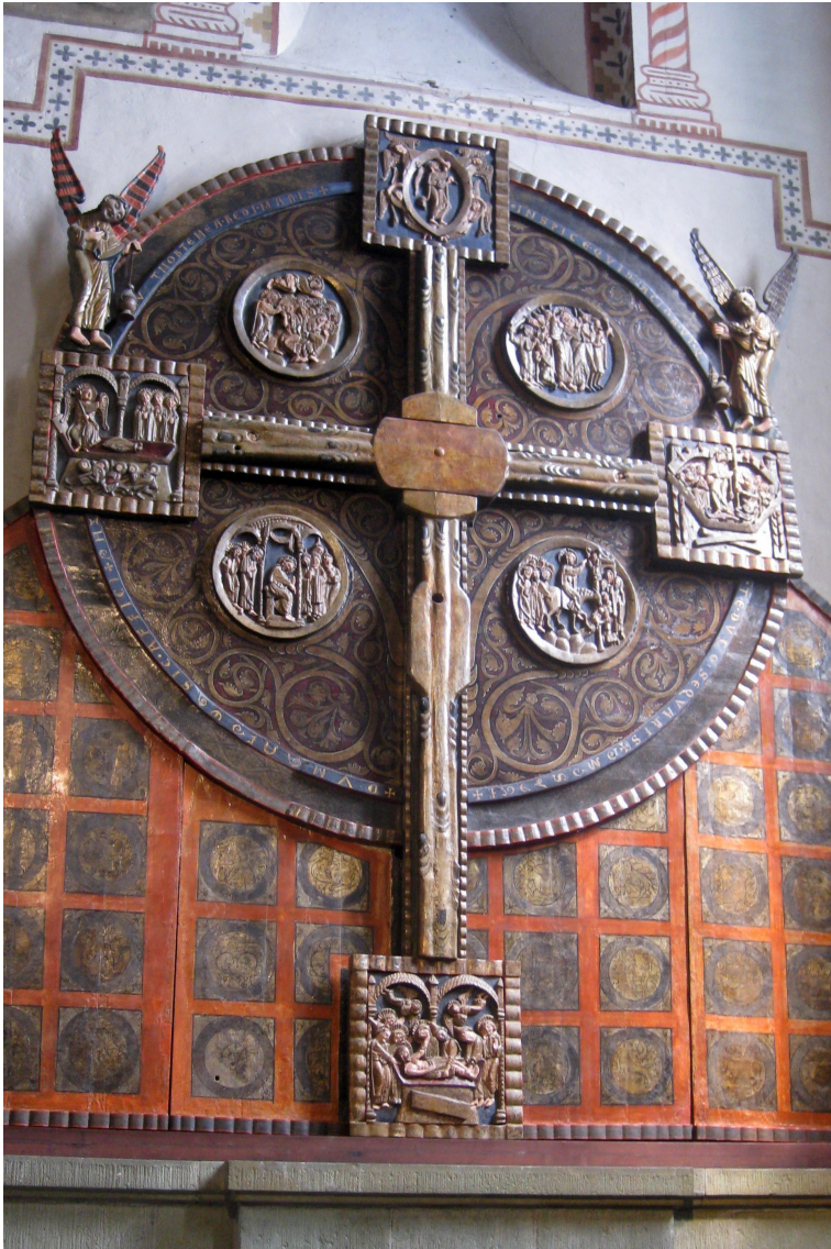
(Triumphkreuz von Soest um 1200)

(in den Medaillons: Einzug, lehrender Chr., Jesus in Gethsemane, Judaskuss. In den Quadraten: Grablegung, Himmelfahrt, Höllenfahrt. Frauen am Grab. Ursprünglich mit Christuscopus)